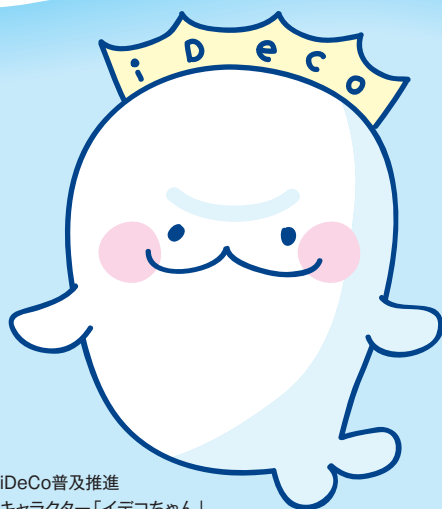
iDeCo普及推進 キャラクター「イデコちゃん」

従業員の方がiDeCoに加入されるにあたっては、事業主による事務手続きが必要となります。事業主の皆さまにおかれましては、従業員の方が速やかにiDeCoに加入できるよう、事業主としてのご協力をお願いします。